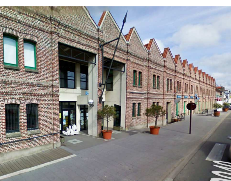
Pôle de la Corderie, Bd Bigot Desceliers 62630 Etaples sur mer